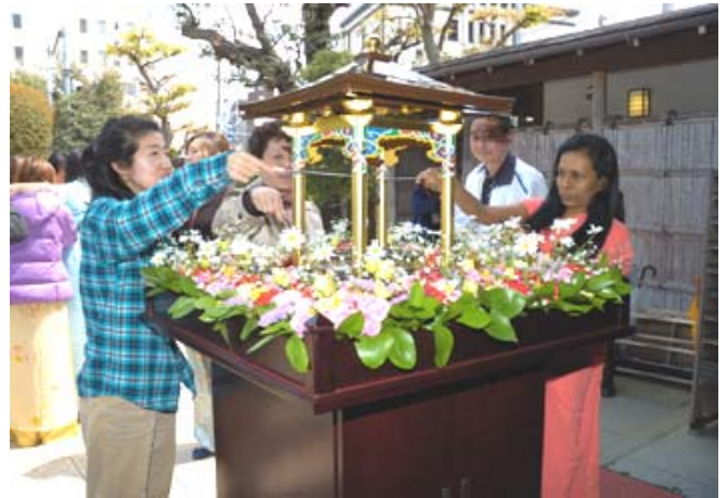
圖為參加者正在浴佛的情景