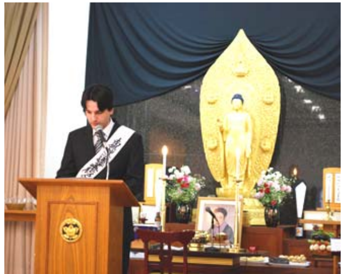
協祖報恩會之際，在巴西教會中說法的情景