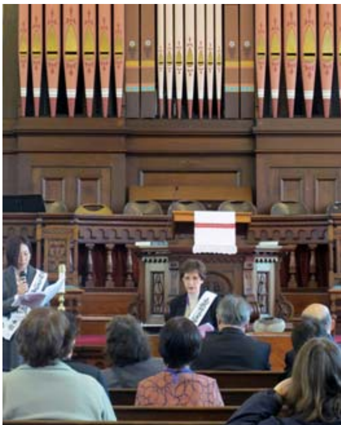
Sra. Hada compartilhando sua experiência como vítima da bomba atômica, em 23 de outubro de 2011, na Igreja First Parish Unitarian, em Massachussets nos EUA

Entretanto, comecei a me distanciar do centro do dharma de Hiroshima. O meu desejo de me separar do meu marido se tornava cada vez mais forte e, quando minha filha estava com dezesseis e meu filho com quatorze anos, não suportei mais e saí de casa. Eu achava que iria ser morta se meu marido me encontrasse, então vivia escondida.