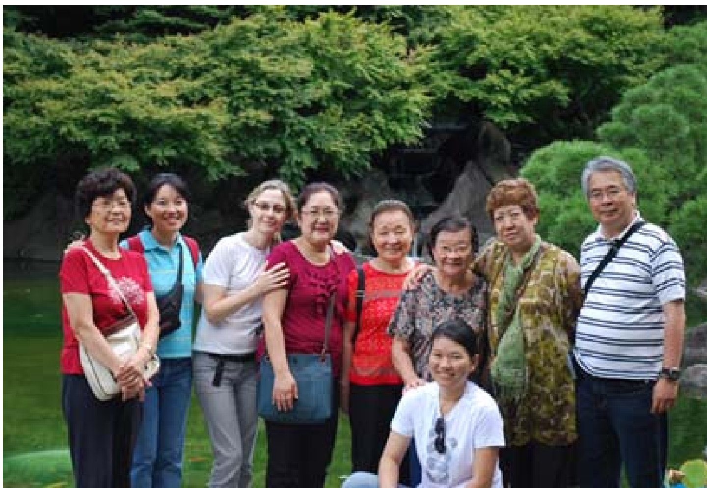
” Номын хүрдэн” өргөөний гаднах цэцэрлэгт хүрээлэнд

Бурхан багш, Үүсгэн байгуулагч, Ерөнхийлөгч бас биднийг ая тухтай хүлээн авсан хүмүүс, мөргөлд хамт оролцсон хүмүүс, эцэст нь илтгэлийг минь чих тавин сонссон та бүхэнд талархсанаа илэрхийлье. Их баярлалаа.